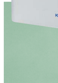
ALMI 2 MINI